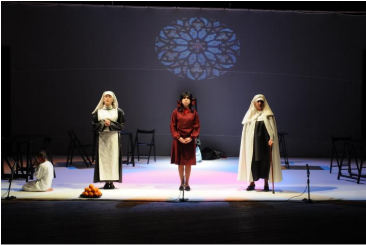
FOTO DI SCENA